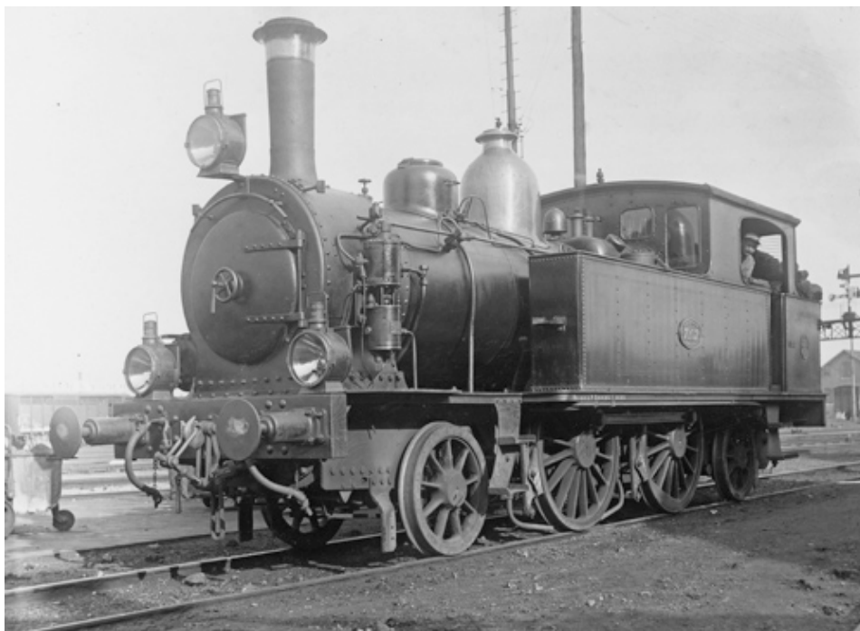
Na 1922 waaierden de NFLS-locs uit over grote delen van Nederland. Hier staat de 7107 in september 1933 te Almelo.